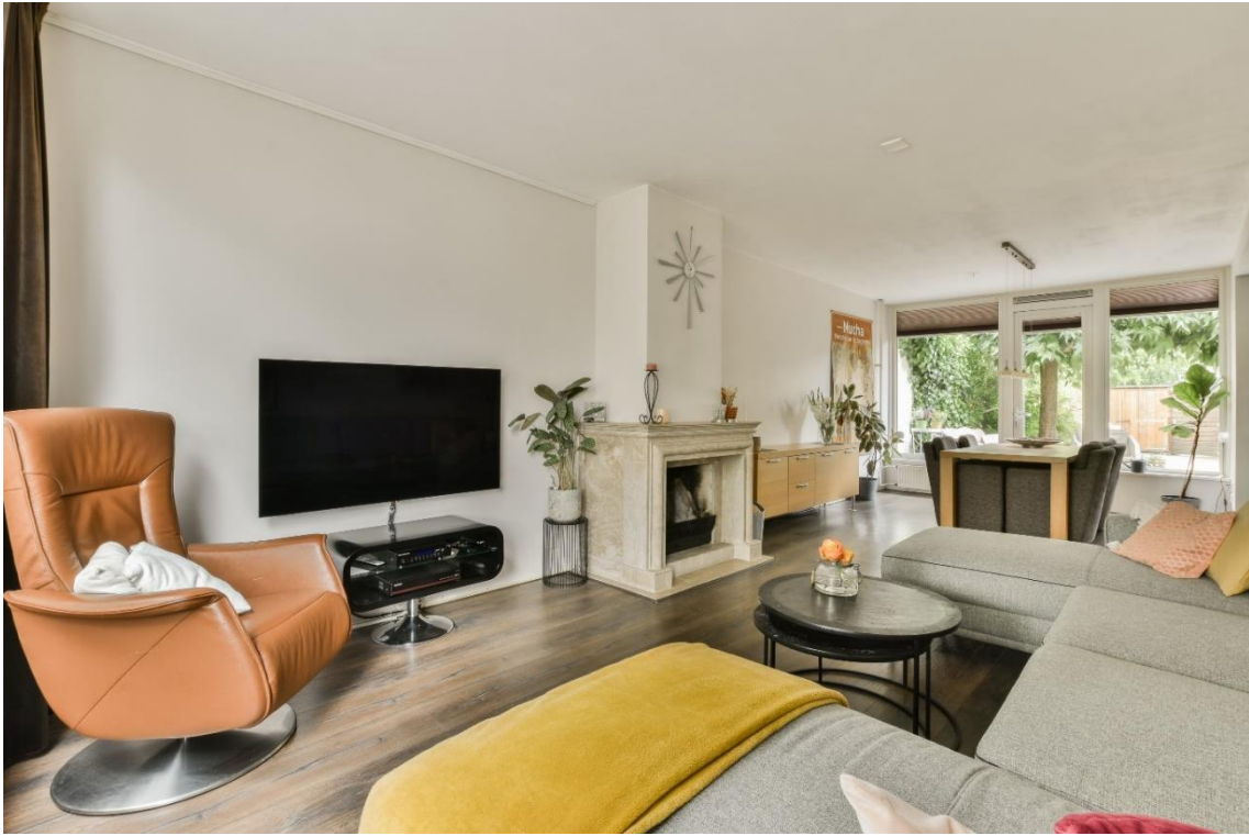
De woonkamer is afgewerkt met gestuukte wanden en een laminaatvloer die uitgevoerd is met brede delen.