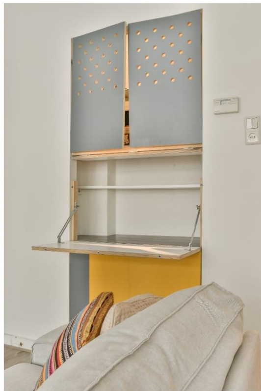
Extra ingebouwde werkplek in de woonkamer